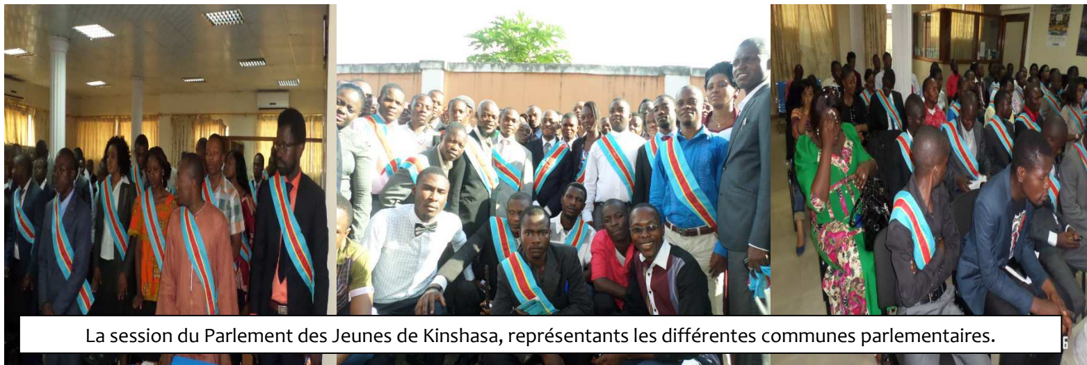
La session du Parlement des Jeunes de Kinshasa, représentants les différentes communes parlementaires.

Il s'est ouvert depuis le mois de Mars 2014, la session ordinaire du Parlement des Jeunes de Kinshasa consacrée essentiellement à la mise en place et à la redynamisation des parlements communaux des jeunes de Kinshasa. Après la validation de leurs mandats, les délégués de vingt quatre communes de Kinshasa se sont vus regroupés à travers les commissions et groupes parlementaires. Certaines réformes d'ordre organisationnel et interne ont été esquissées.