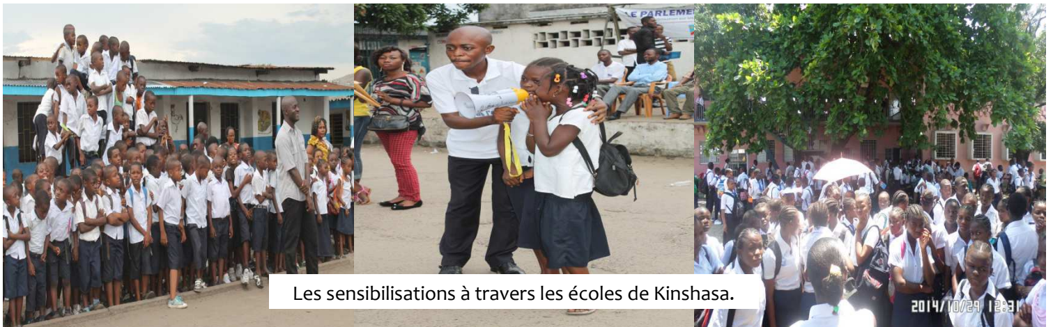
Les sensibilisations à travers les écoles de Kinshasa.

Ce programme s'inscrit dans le cadre du projet de lutte contre la violence faite à l'enfant à Kinshasa. Le Parlement des Jeunes de la RDC poursuit sa campagne de sensibilisation jusqu'en 2017 à travers les écoles et communes de Kinshasa pour porter à la connaissance des communautés locales les droits