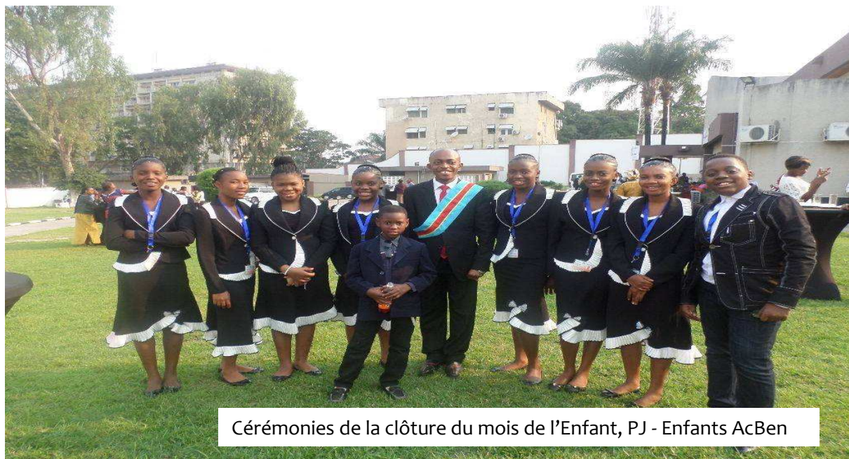
Cérémonies de la clôture du mois de l'Enfant, PJ - Enfants AcBen

Change, USAID, Société Civile, l'Union Africaine et le Gouvernement de la RDC, les activités de plaidoyer ont été rendues possibles.